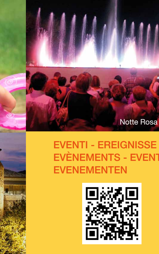
Notte Rosa 3/7

EVENTI - EREIGNISSE EVÈNEMENTS - EVENTS EVENEMENTEN